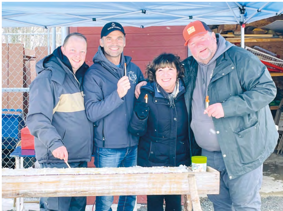
Fête d'hiver du 12 février 2022

Nous souhaitons que la météo sera clémente pour favoriser un beau temps des Sucres. Nous espérons que vous pourrez profiter de la patinoire pendant encore quelques semaines. Notre milieu de vie nous permet d'être à l'extérieur dans un environnement sain et d'une grande beauté. Laissons nos paysages nous remplir de joie et de sérénité.